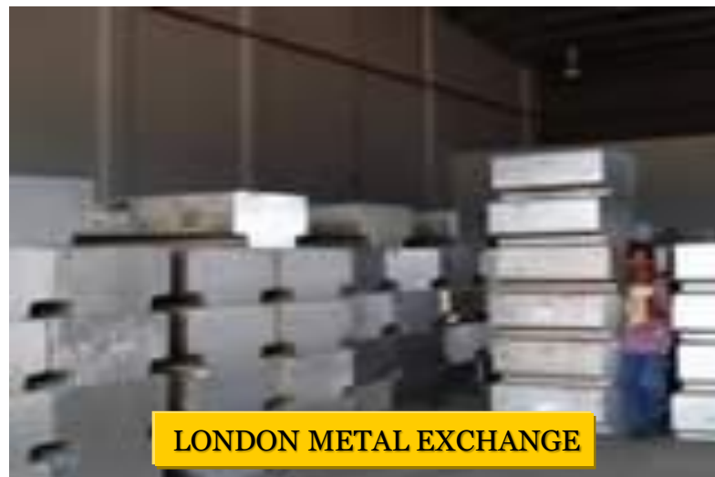
LONDON METAL EXCHANGE