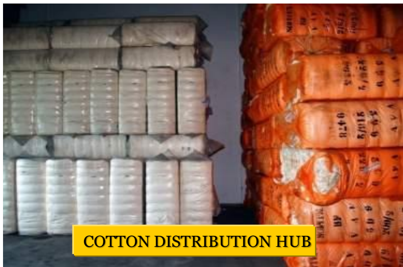
COTTON DISTRIBUTION HUB